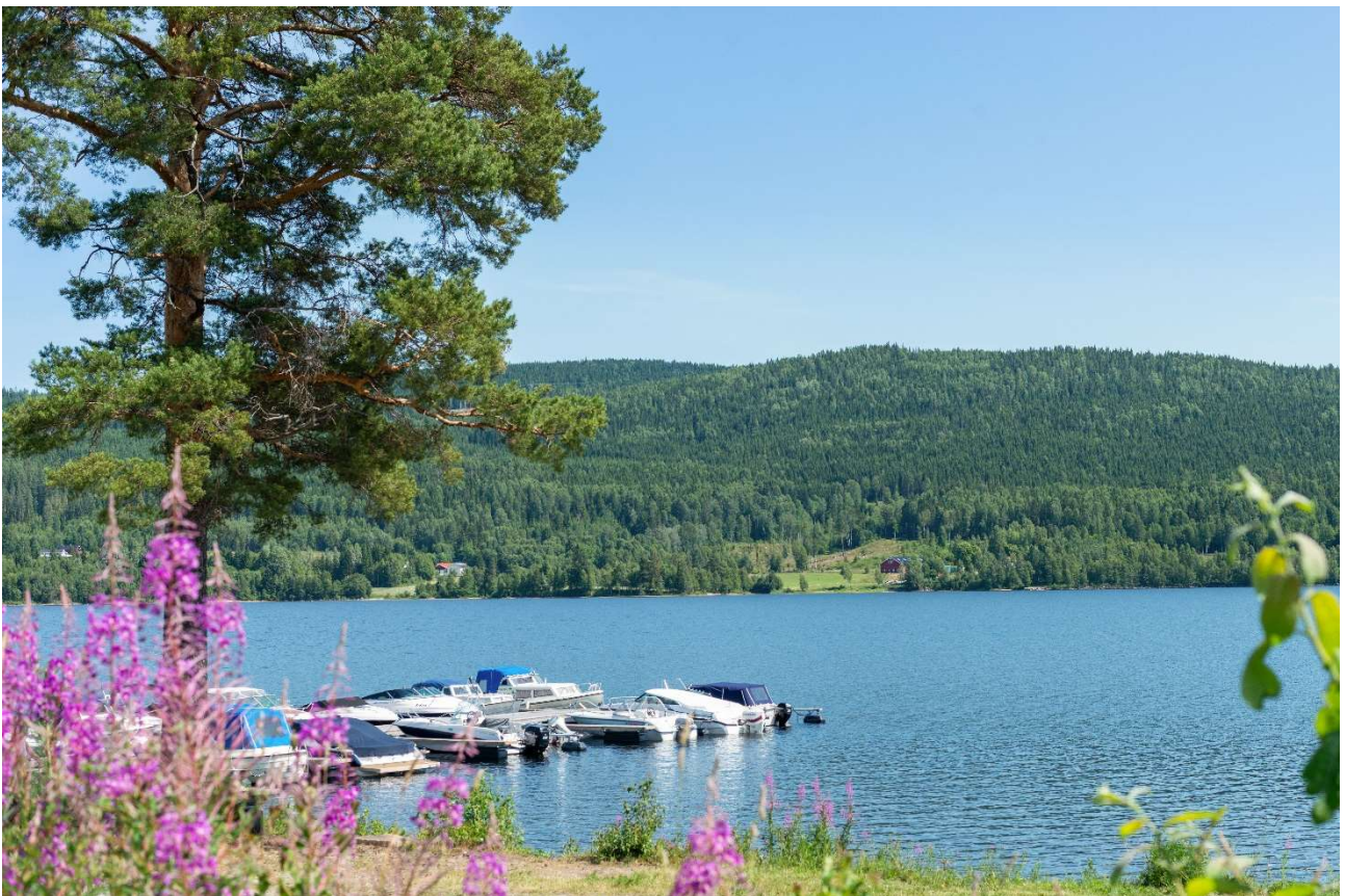
Småbåthavnen ved Hurdalsjøen.

Det tas forbehold om å fortsette budrunden neste dag dersom handel ikke er kommet i stand innen kl. 15.30 eller innen budgivernes bank-kontakt er mulig å få tak i pr. telefon.