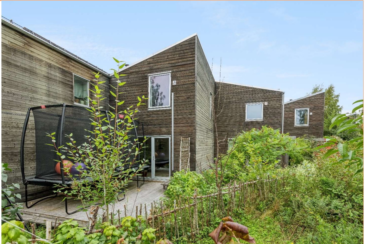
Terrassen på baksiden. Hasseltre, epletre, jordbær, urter og rabarbraplante.