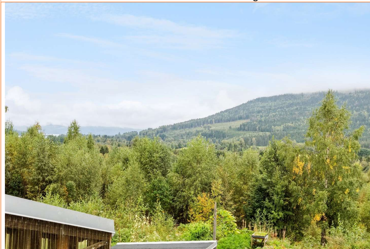
Under: Utsikt fra soverom i 2. etg.