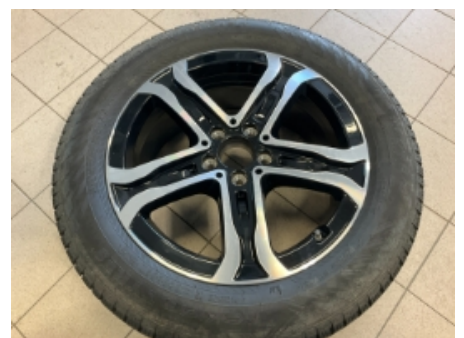
36. Ekstra hjulsett