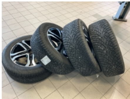
32. Ekstra hjulsett