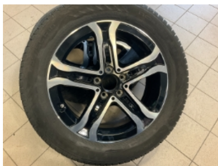
35. Ekstra hjulsett