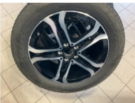
34. Ekstra hjulsett