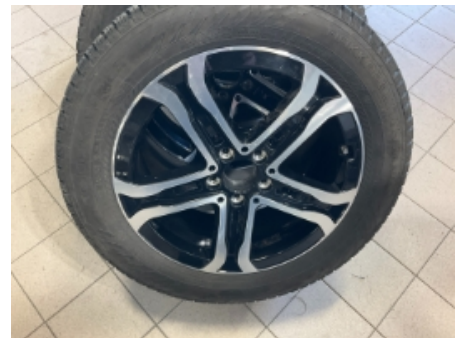
33. Ekstra hjulsett