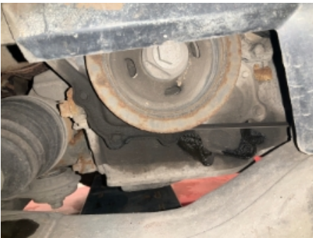
28. Utvendig tilstand motor