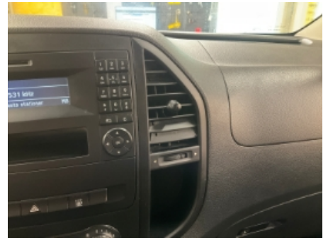
15. Luftdyse kupé