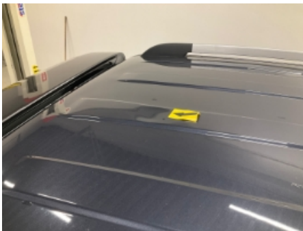
19. Lakk / karosseri utvendig