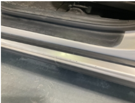
16. Lakk / karosseri utvendig