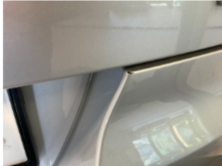
8. Lakk / karosseri utvendig