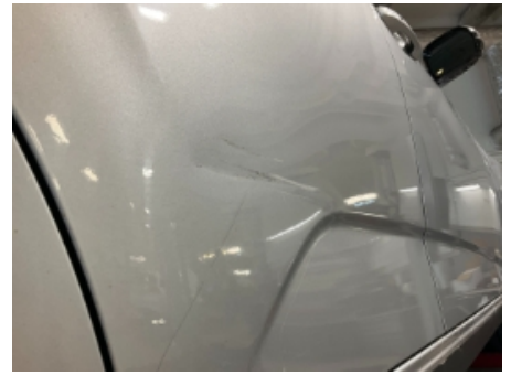
27. Lakk / karosseri utvendig