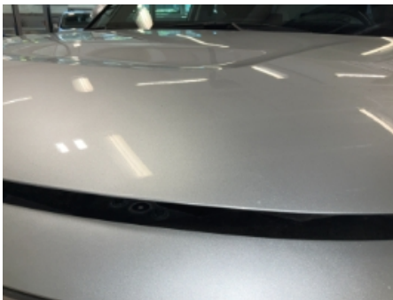
43. Lakk / karosseri utvendig