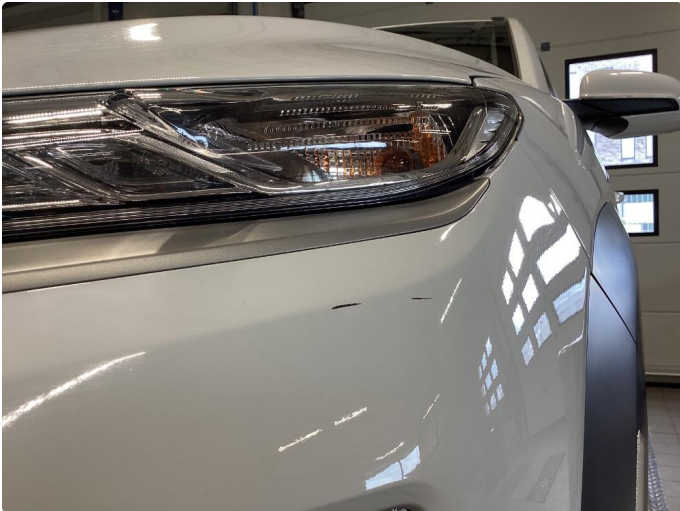
1.1 Ripe(r) ned til grunning