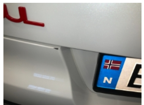
36. Lakk / karosseri utvendig