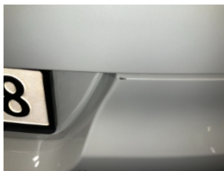
35. Lakk / karosseri utvendig