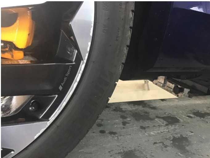
1.2 Litt kantkjørt felg