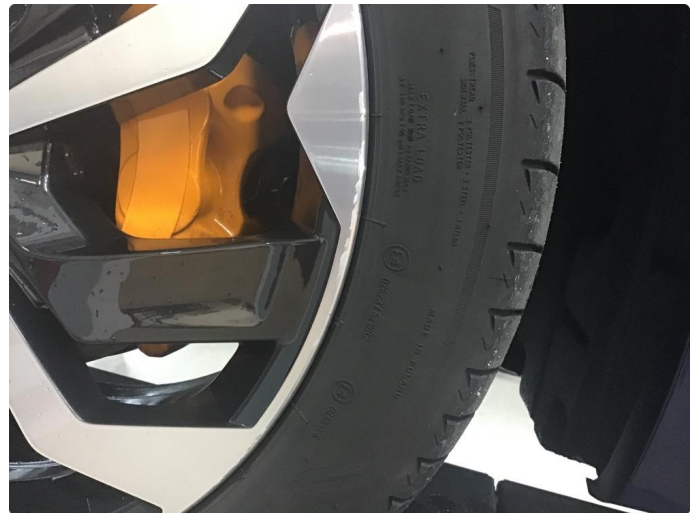
1.2 Litt kantkjørt felg