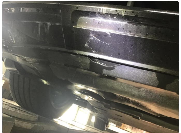
1.3 Må skrap under støtfanger