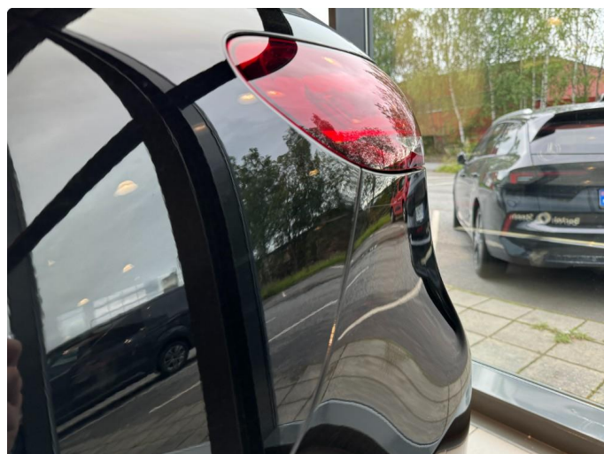
1.4 Ripe på bakskjerm