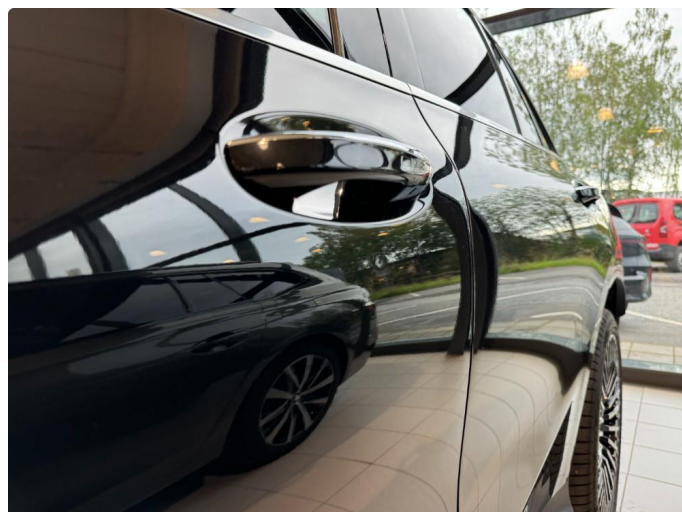
1.2 Liten parkeringsbulk på førerdør