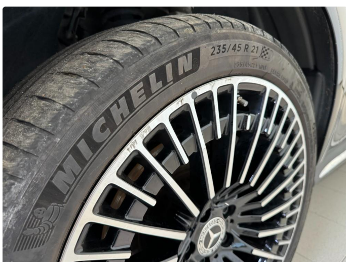
1.5 Kantkjørt sommerfelg