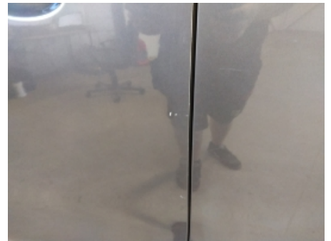
18. Venstre fordør