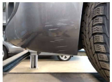
24. Støtfanger foran