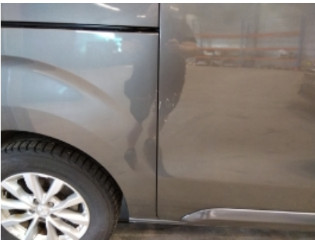
16. Høyre bakdør