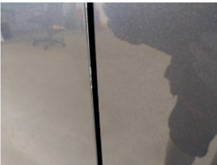
19. Venstre bakdør