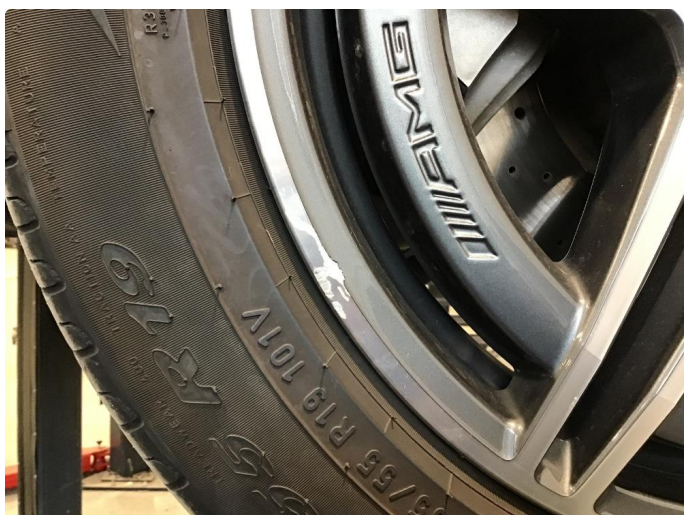
1.2 Ripe (r) gjennom lakk