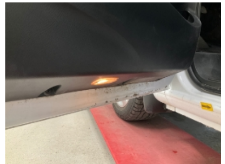
21. Lakk / karosseri utvendig