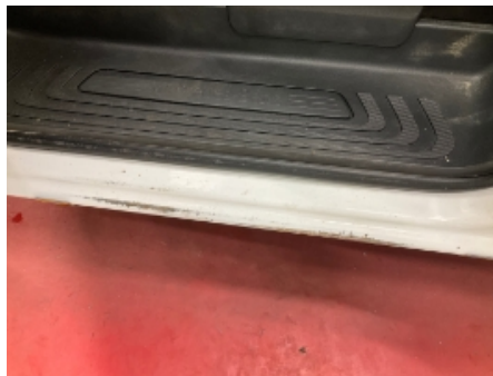
20. Lakk / karosseri utvendig