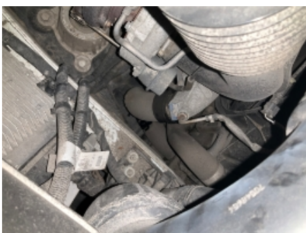
22. Utvendig tilstand motor