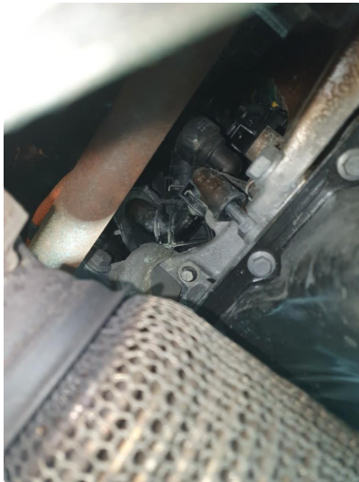
1.2 Oljelekkasje fra motor