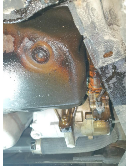
1.2 Oljelekkasje fra motor