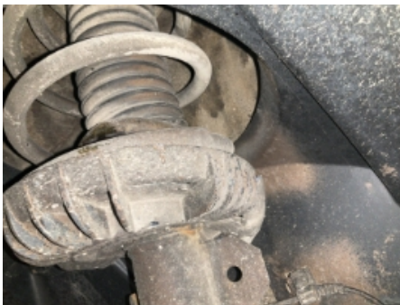
31. Fjærer / fjærbein