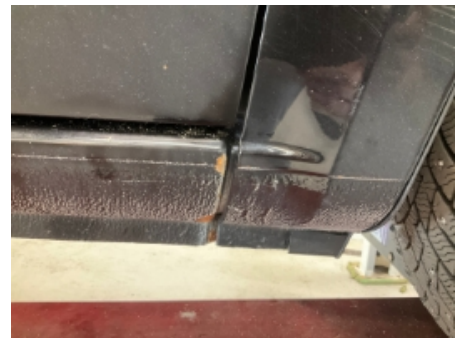
21. Lakk / karosseri utvendig