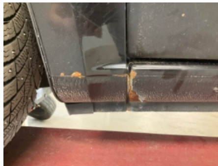
20. Lakk / karosseri utvendig