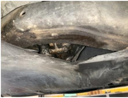
25. Girkasse (automatisk)