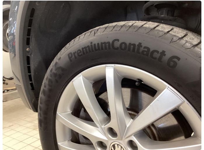
1.2 Kantkjørt felg