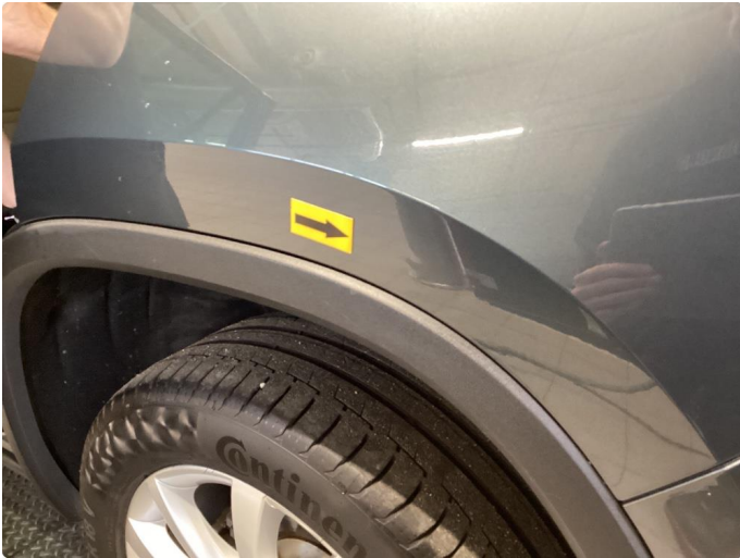
1.1 Bruks Merker