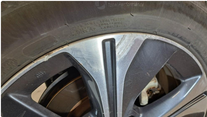
1.1 Kantkjørt felg.