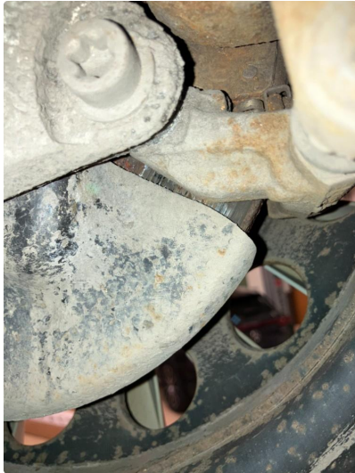
1.1 Skal inn for kontroll på verkstedet og få utbedret dette.