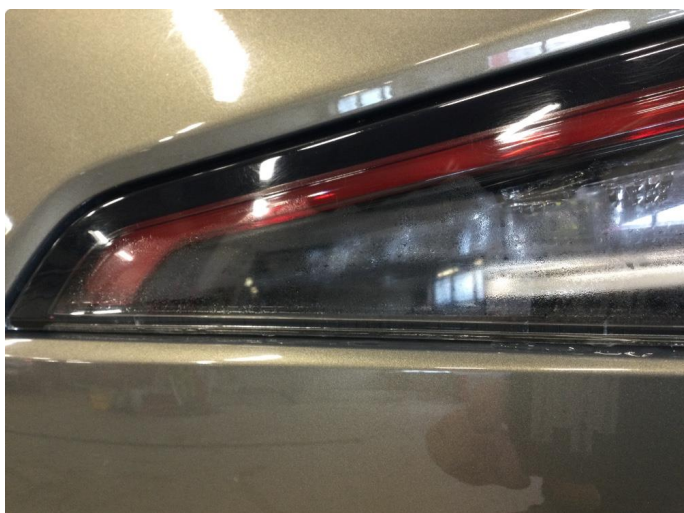
2.1 Krakelering i plast