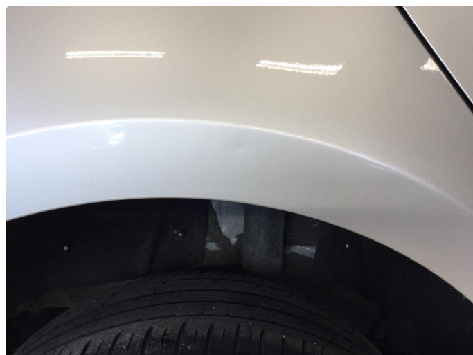
1.4 P-bulk rettes