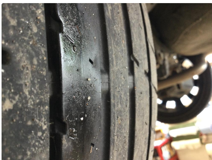
1.5 For liten mønsterdybde sommerdekk Nye bestilles