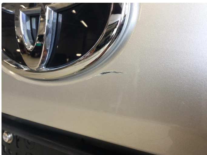
1.3 Ripe flekkes