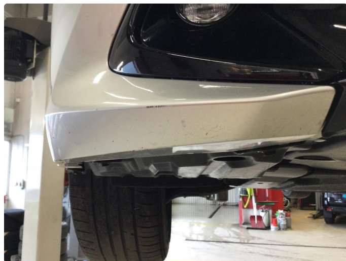
1.6 Ripe(r) flekkes