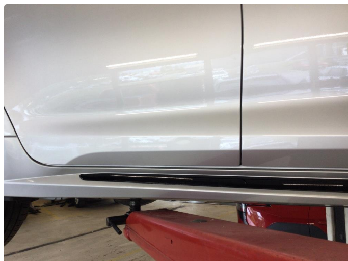
1.2 Bulk rettes