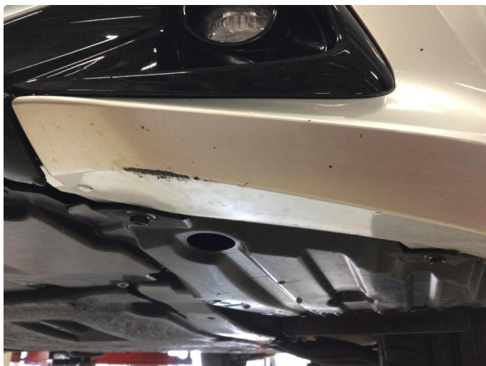
1.6 Ripe(r) flekkes