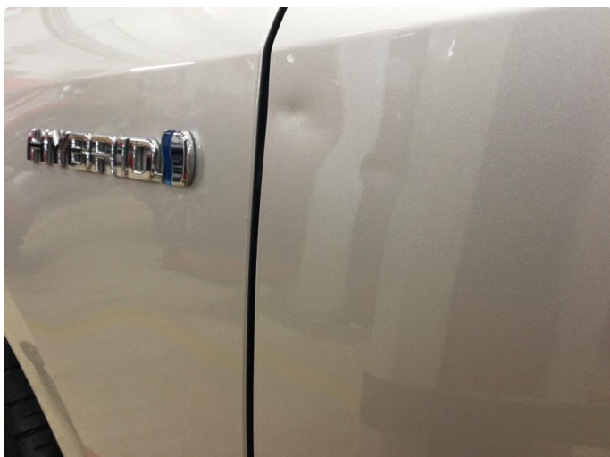
1.1 Bulk rettes