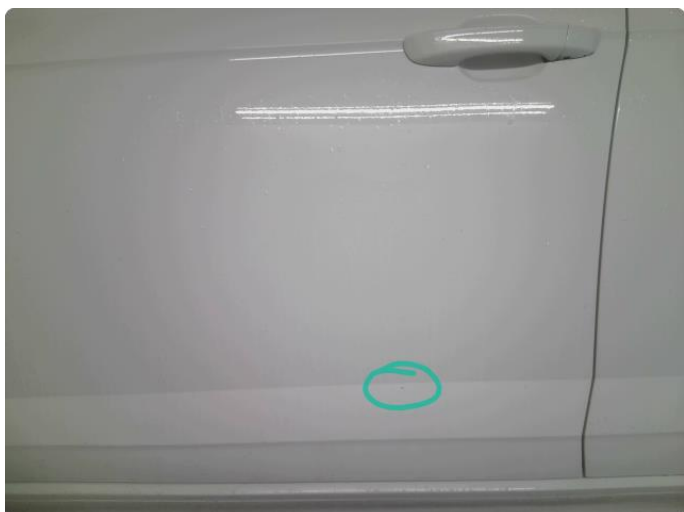
1.1 Steinsprut med rust