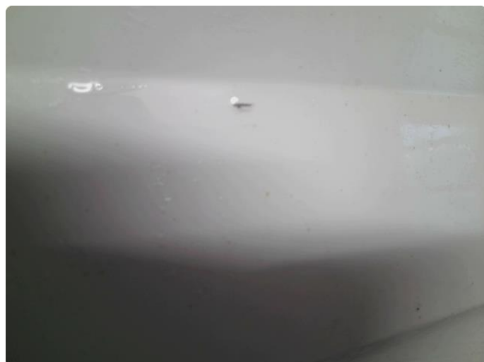
1.1 Steinsprut med rust