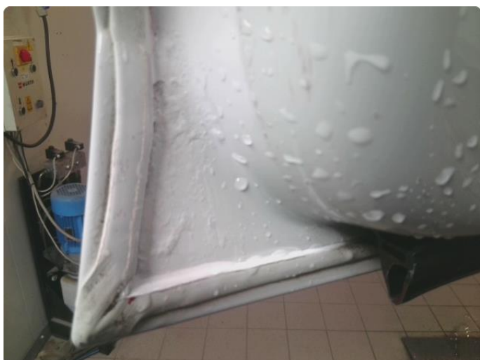
1.2 Rust i fals