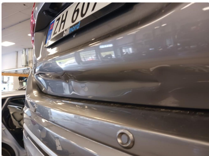
1.1 Lakkeres før levering grunnet skade