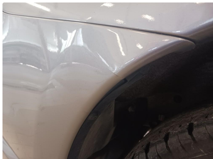
1.2 Lakkeres før levering grunnet skade