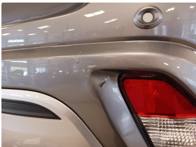
1.2 Lakkeres før levering grunnet skade