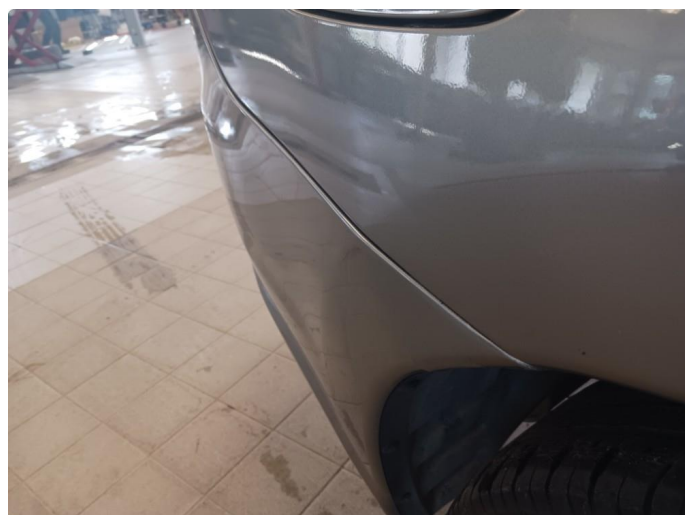
1.2 Lakkeres før levering grunnet skade