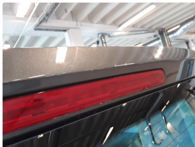
1.4 Noen riper øvre del av bakluke.