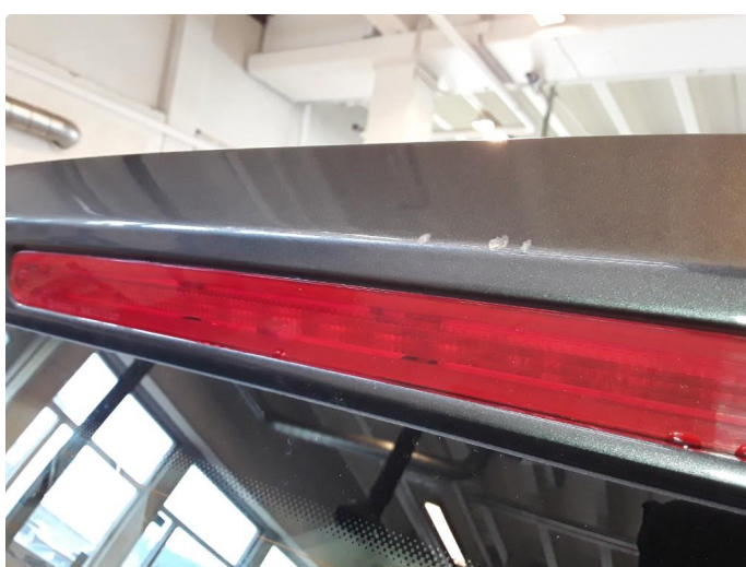
1.4 Noen riper øvre del av bakluke.