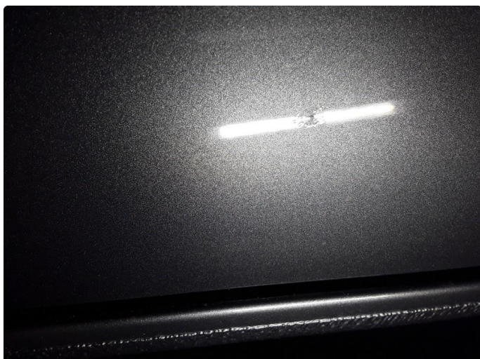
1.2 Steinsprut med korrosjon venstre skyvedør.