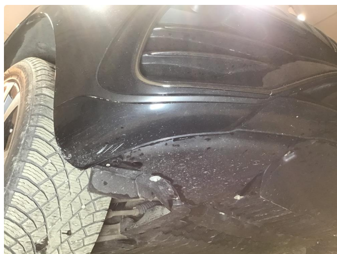
1.5 Skrubbskader underkant