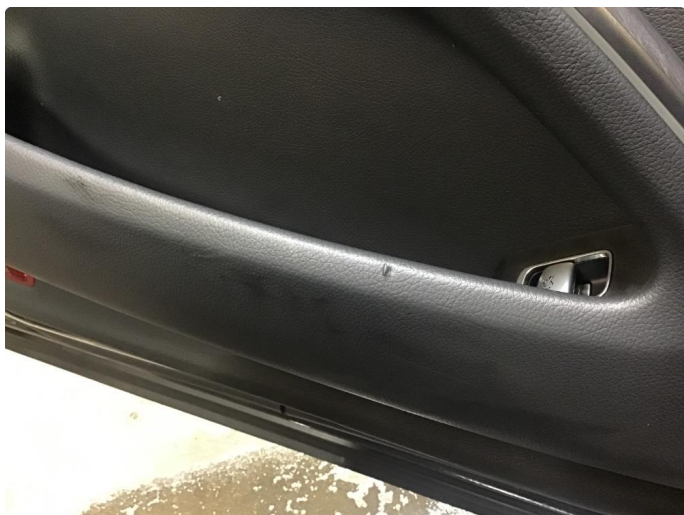
2.1 Skadet/merker etter utstyr