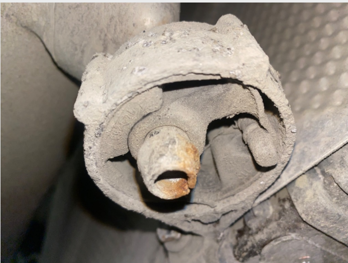
5.6 de to bakerste eksos festene har sluppet i gummi.