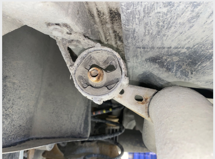
5.6 de to bakerste eksos festene har sluppet i gummi.