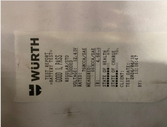
5.2 Batteriteat utført, ok