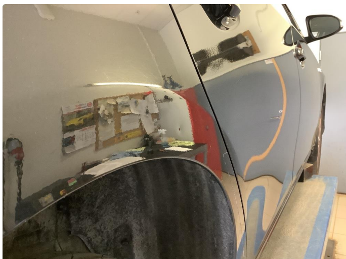
1.1 Noen riper og småbulker / Blir Penslet