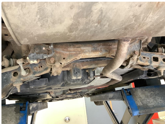
1.2 Noe Over flate rust under bilen