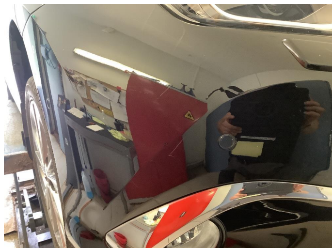
1.1 Noen riper og småbulker / Blir Penslet