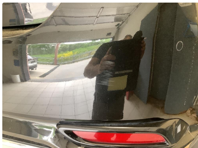
1.1 Noen riper og småbulker / Blir Penslet