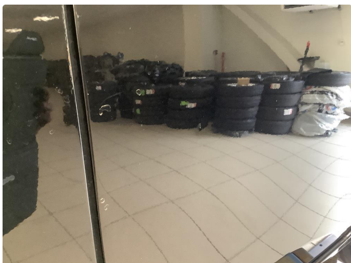
1.1 Noen riper og småbulker / Blir Penslet