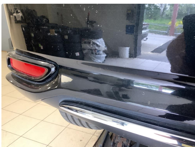
1.1 Noen riper og småbulker / Blir Penslet