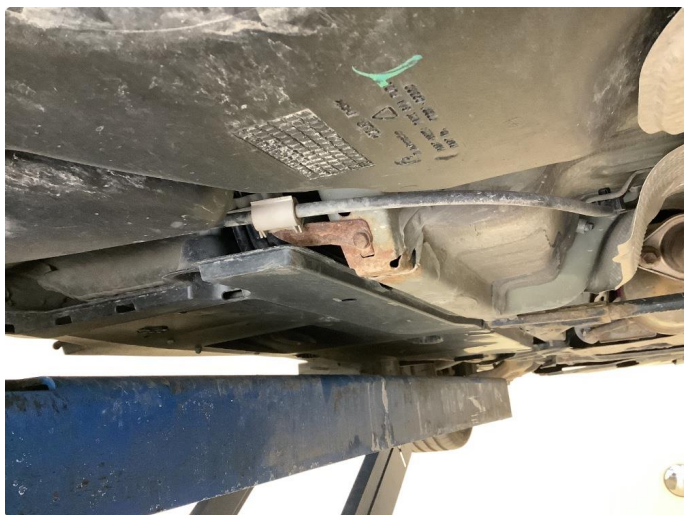
1.2 Noe Over flate rust under bilen