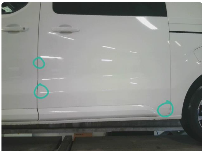
1.1 Steinsprut med rust