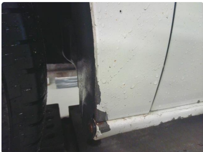
1.6 Lakk flasser