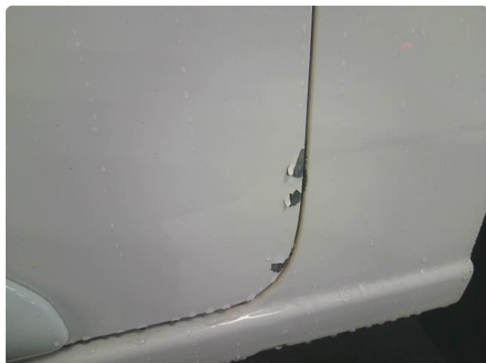
1.1 Steinsprut med rust