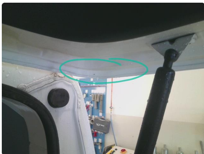
1.5 Rust i fals