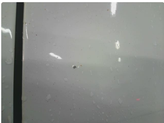
1.1 Steinsprut med rust