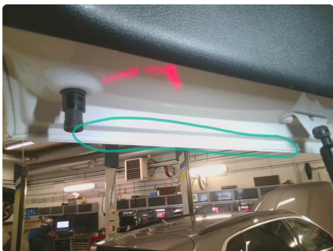
1.5 Rust i fals