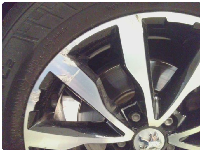
1.8 Kantkjørt felg