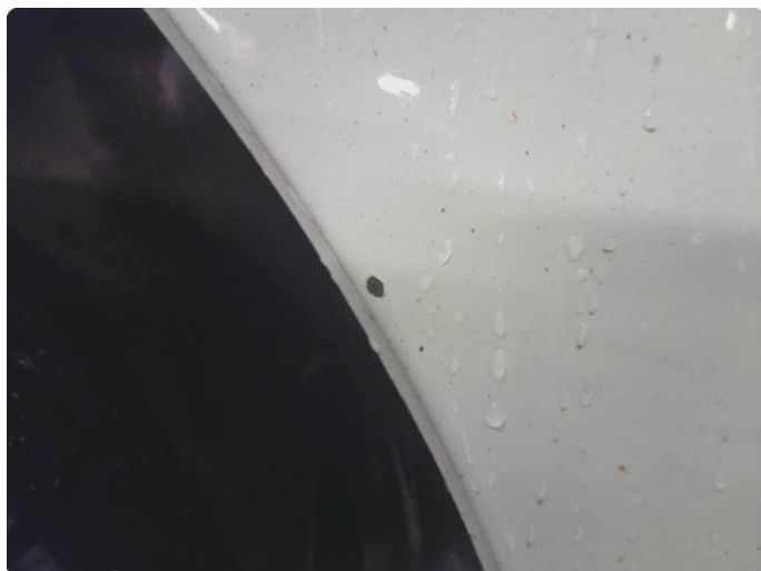
1.6 Lakk flasser