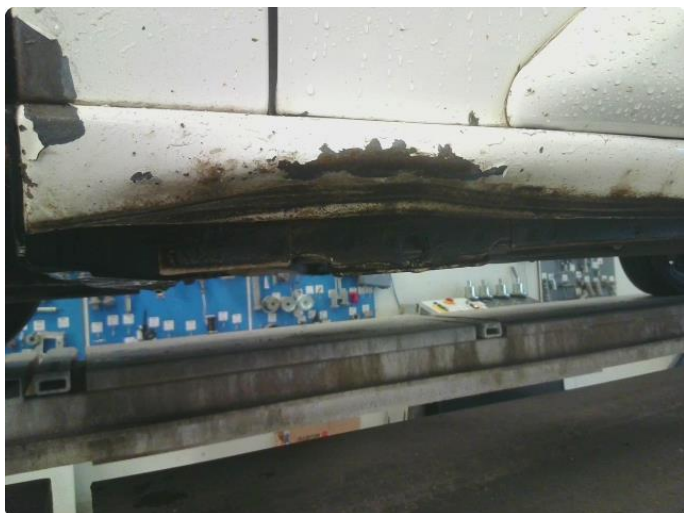
1.10 Bulk med lakkskade