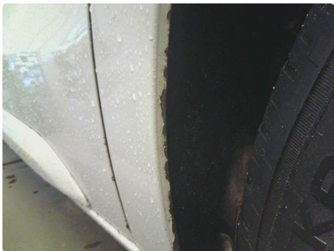
1.7 Lakk flasser