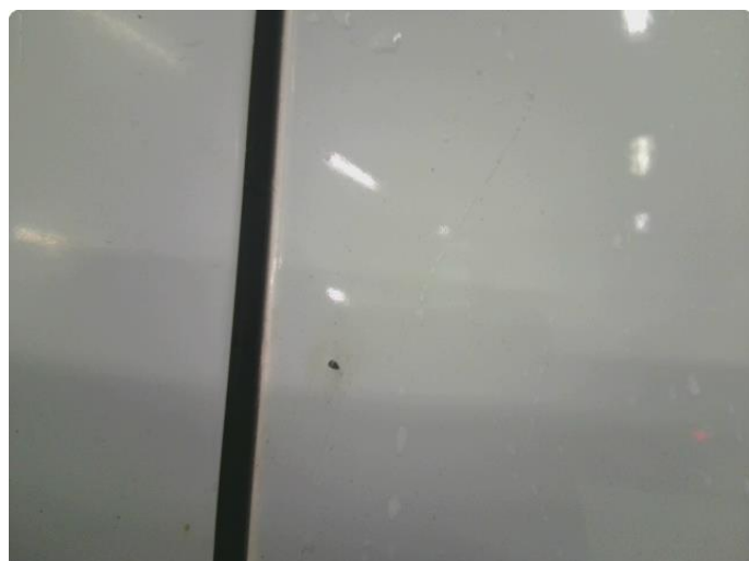
1.1 Steinsprut med rust