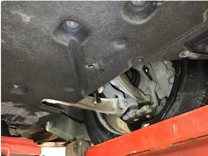
1.1 Beskyttelsesplate skadet/mangler