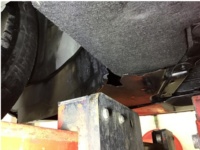
1.1 Beskyttelsesplate skadet/mangler