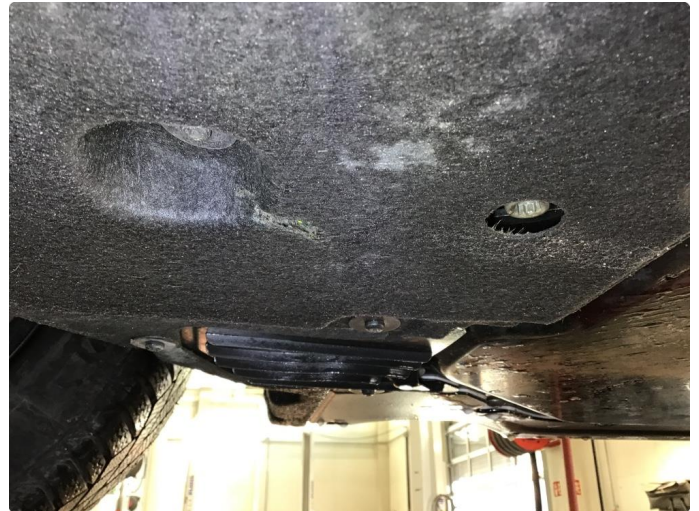
1.1 Beskyttelsesplate skadet/mangler