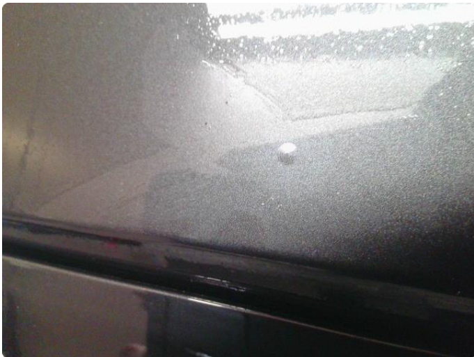
1.1 Steinsprut med rust