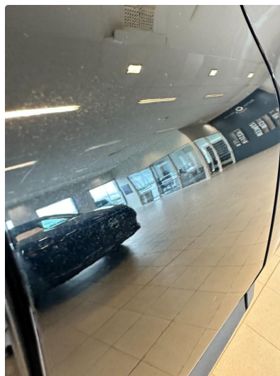
1.1 Liten ripe og bulk.