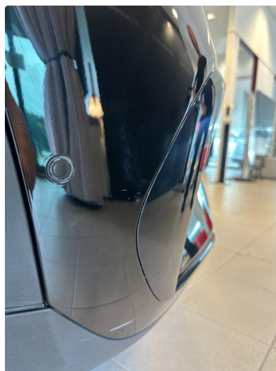
1.3 Små riper.