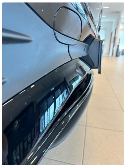
1.2 Ripe/ hakk i frontfanger.