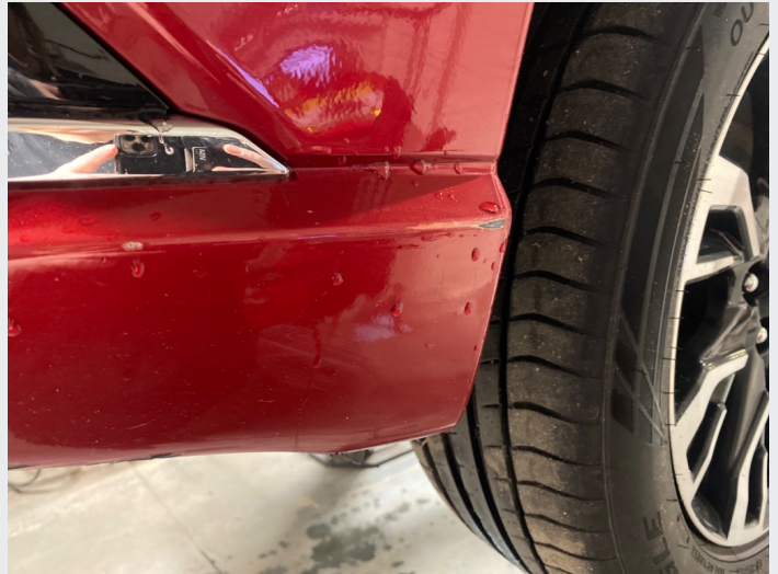
2.8 Skrubbsår støtfanger venstre foran, nedre