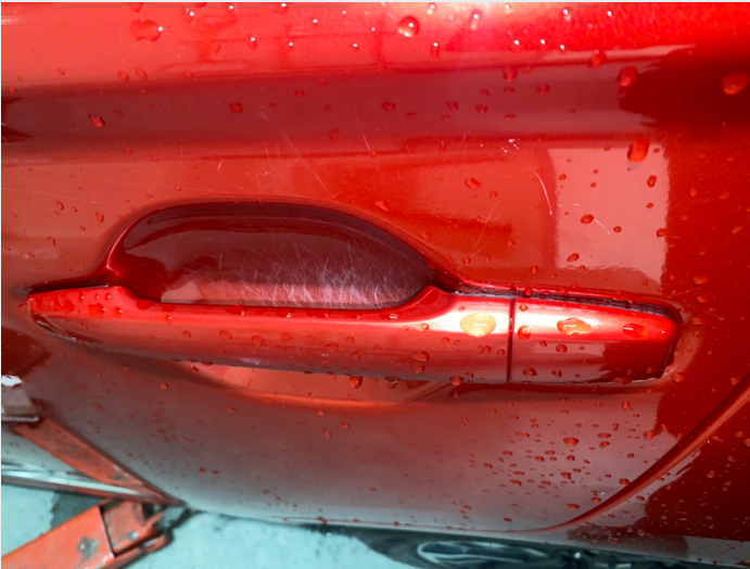
2.1 Div slitasje på lakk, normalt ift. Alder