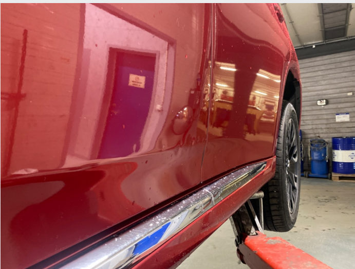
2.5 Førerdør, mange bulker