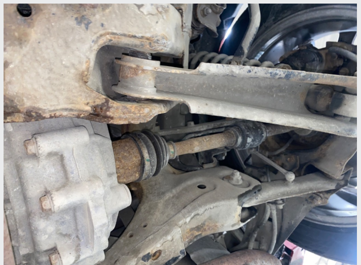
8.5 ikke understells behandlet, så har påbegynnende rust under.