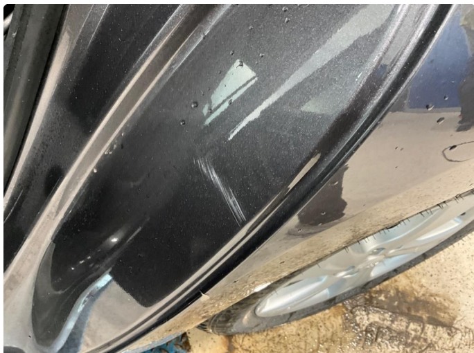
1.1 Noe slitasje i døråpning. Venstre bak.