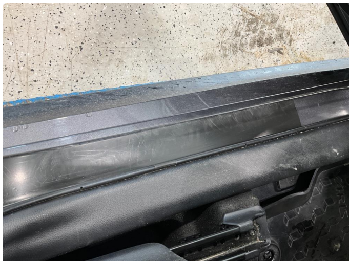
1.2 Noe slitasje på dørterskel, venstre foran.