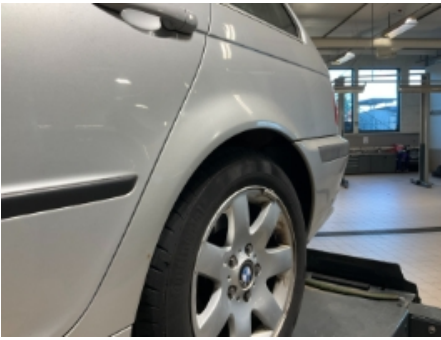
25. Lakk / karosseri utvendig