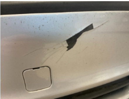
28. Lakk / karosseri utvendig