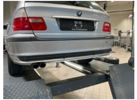
27. Lakk / karosseri utvendig