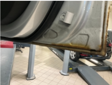
31. Lakk / karosseri utvendig