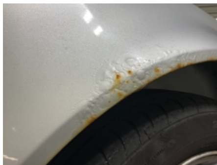
35. Lakk / karosseri utvendig