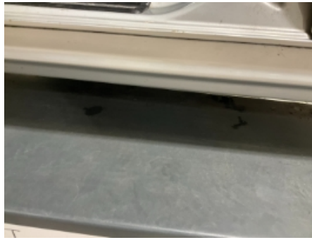
38. Lakk / karosseri utvendig