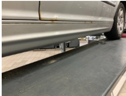
32. Lakk / karosseri utvendig