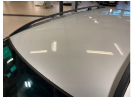
18. Lakk / karosseri utvendig