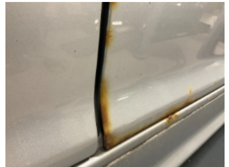
30. Lakk / karosseri utvendig