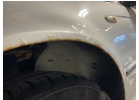
21. Lakk / karosseri utvendig