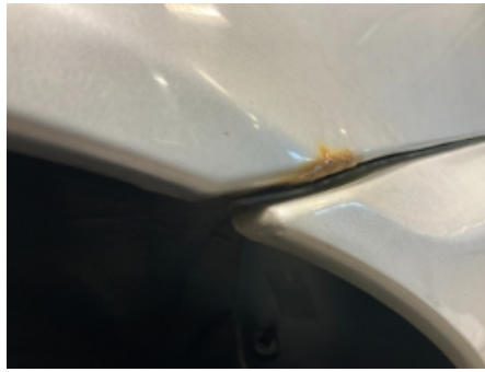
26. Lakk / karosseri utvendig