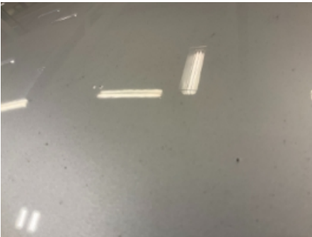
19. Lakk / karosseri utvendig