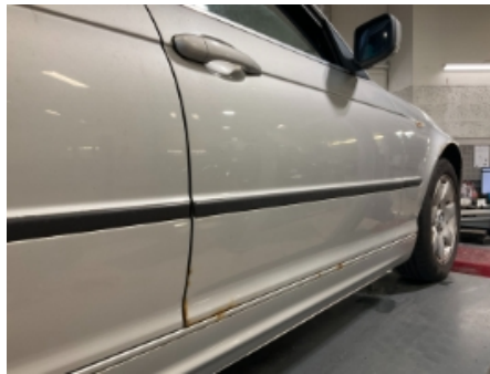
29. Lakk / karosseri utvendig