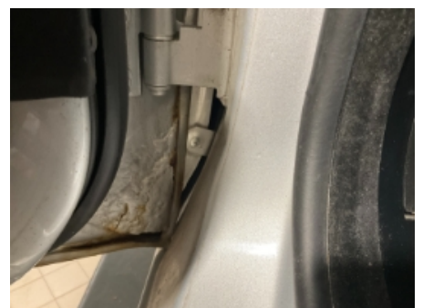
24. Lakk / karosseri utvendig