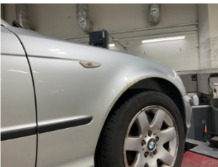
34. Lakk / karosseri utvendig