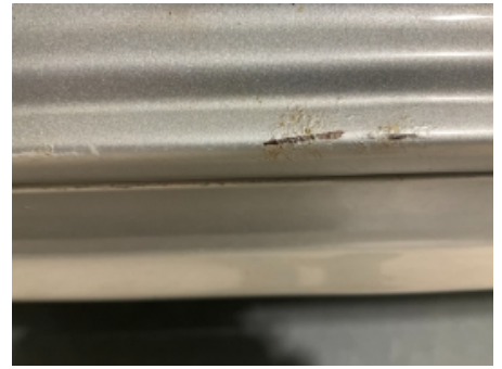
39. Lakk / karosseri utvendig