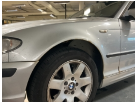
20. Lakk / karosseri utvendig