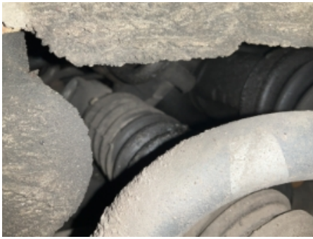
37. Utvendig tilstand motor