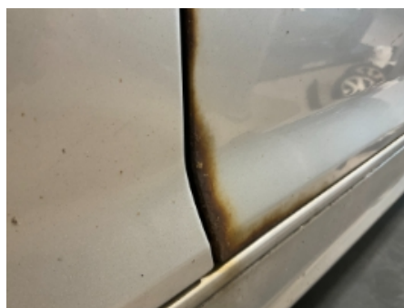
23. Lakk / karosseri utvendig