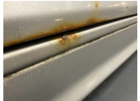
33. Lakk / karosseri utvendig