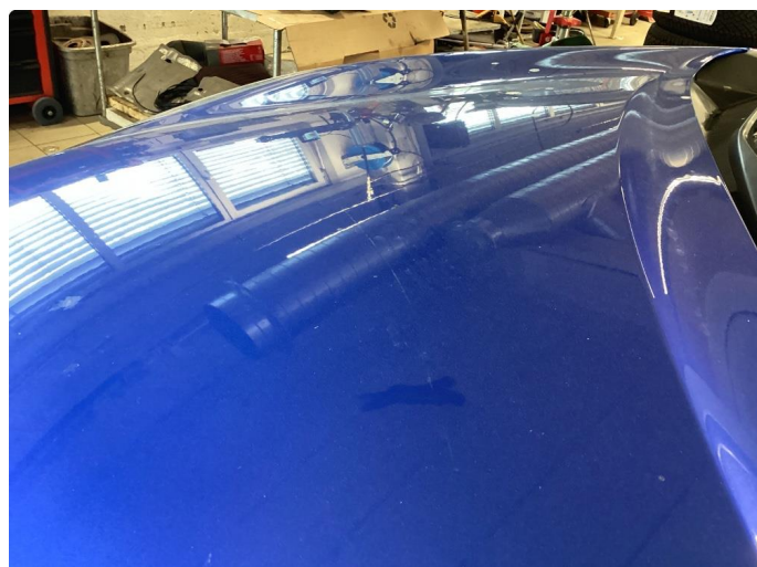
1.1 Noe bruksriper og steinsprut, normalt bruk