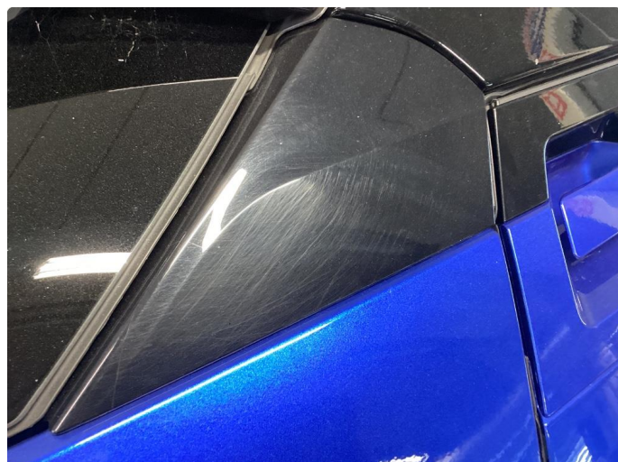
1.1 Noe bruksriper og steinsprut, normalt bruk