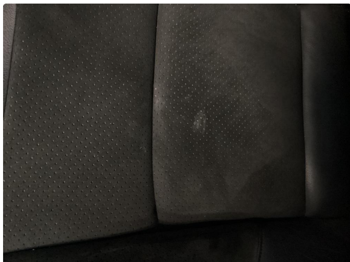
3.2 Generelt mye bruksslitasje