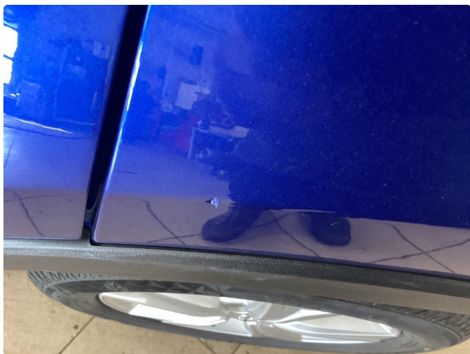
1.1 Noe bruksriper og steinsprut, normalt bruk