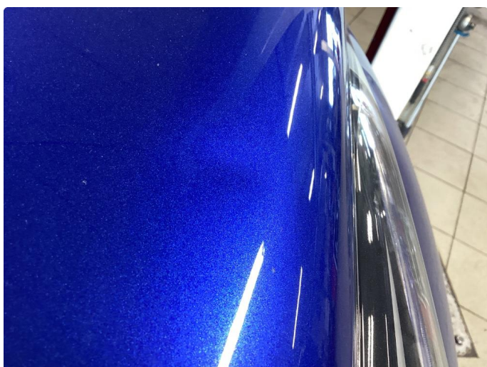
1.1 Noe bruksriper og steinsprut, normalt bruk