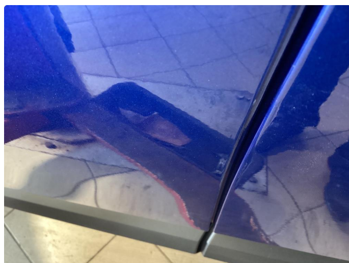
1.1 Noe bruksriper og steinsprut, normalt bruk