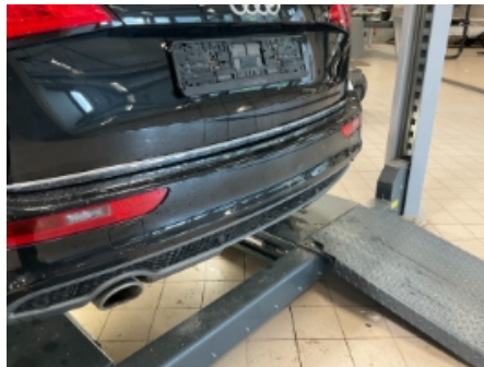
17. Lakk / karosseri utvendig