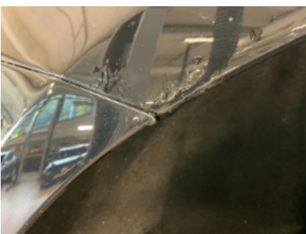
22. Lakk / karosseri utvendig