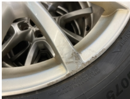
20. Ekstra hjulsett