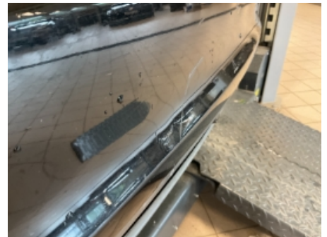
18. Lakk / karosseri utvendig