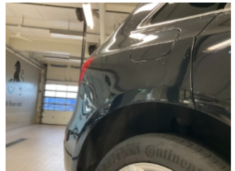
21. Lakk / karosseri utvendig