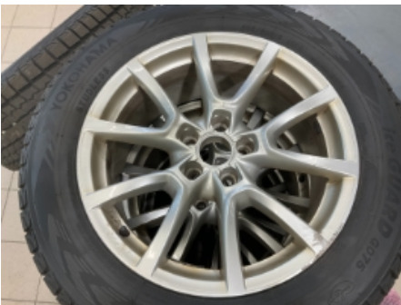
19. Ekstra hjulsett