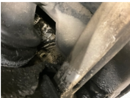
4. Utvendig tilstand motor