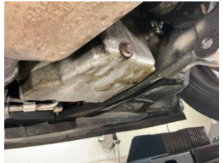
3. Utvendig tilstand motor