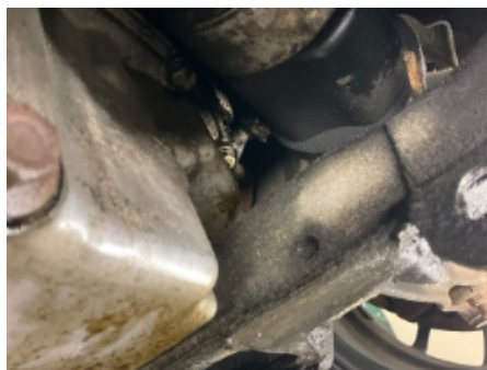
5. Utvendig tilstand motor