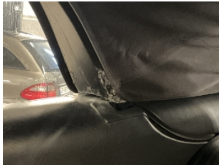
2. Interiør generelt