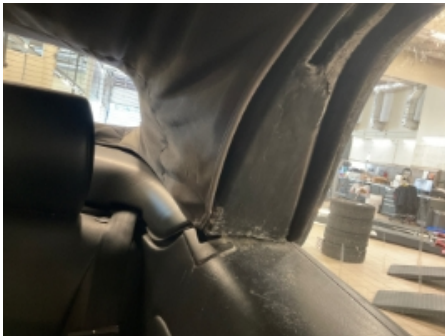
1. Interiør generelt