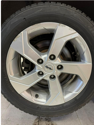
1.1 En vinterfelg har noen merker