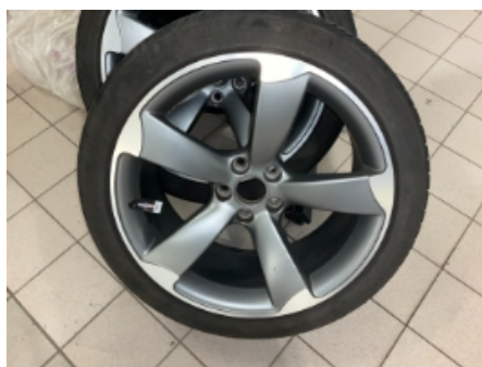
35. Ekstra hjulsett