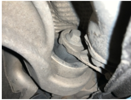
38. Opphengs- / bærearmer foraksel