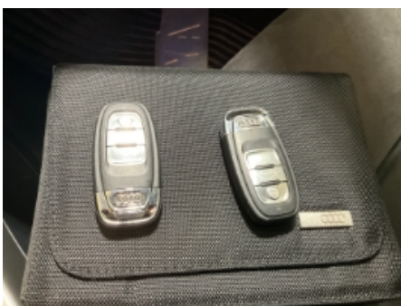
22. Nøkler / Utstyr