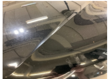
42. Lakk / karosseri utvendig