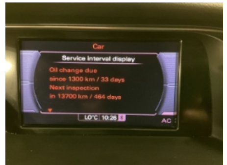
21. Service/ Dokum.