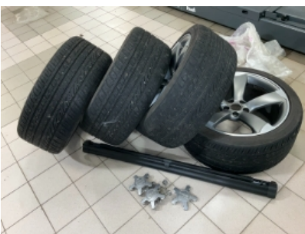
34. Ekstra hjulsett