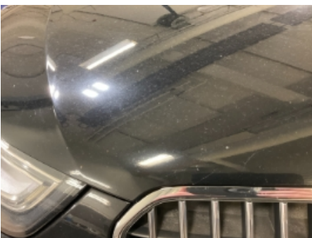
43. Lakk / karosseri utvendig