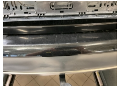
51. Lakk / karosseri utvendig