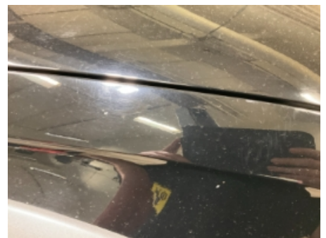
45. Lakk / karosseri utvendig