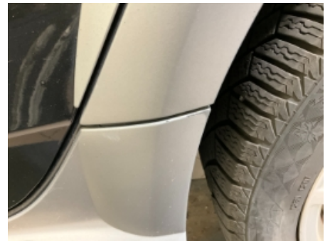
54. Lakk / karosseri utvendig