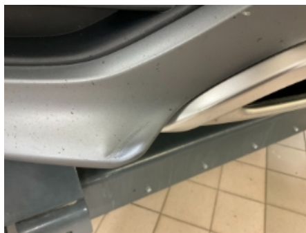
44. Lakk / karosseri utvendig