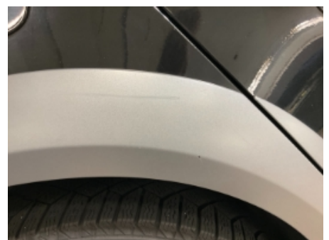
48. Lakk / karosseri utvendig