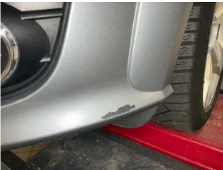
40. Lakk / karosseri utvendig