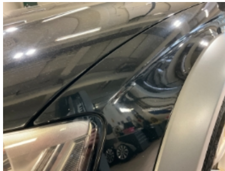
41. Lakk / karosseri utvendig