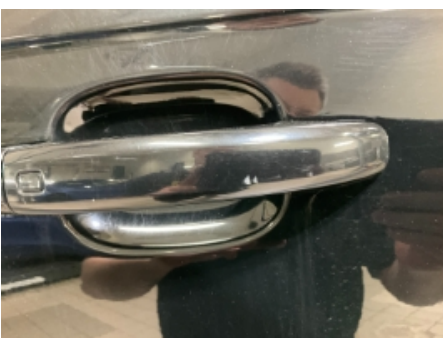
46. Lakk / karosseri utvendig