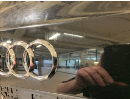
52. Lakk / karosseri utvendig