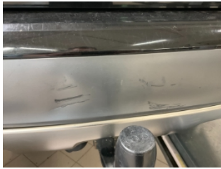
50. Lakk / karosseri utvendig