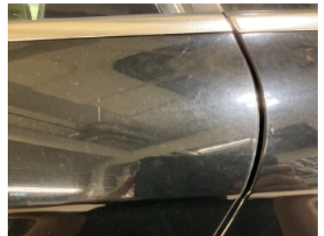
57. Lakk / karosseri utvendig