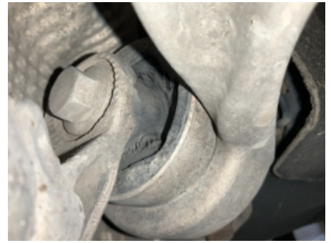
39. Opphengs- / bærearmer foraksel