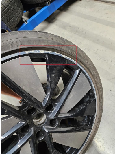
1.1 Noe skrubbermerker, ytre kant, på 1 stk sommerfelg (bak)