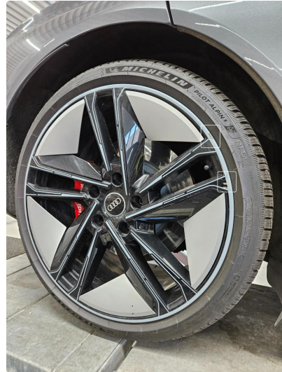
1.2 Noe skrubbermerker, ytre kant, på 1 stk vinterfelg (bak)