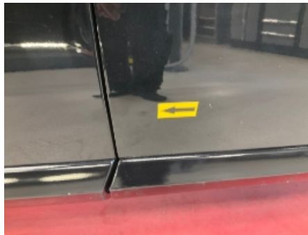
29. Høyre fordør