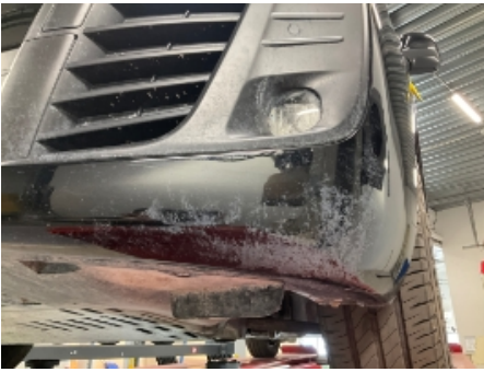
25. Støtfanger foran