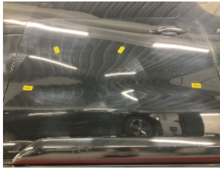
26. Høyre bakdør