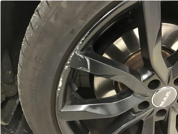
1.1 Sår på felg