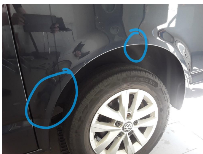
1.2 Steinsprut med rustboble