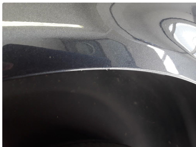
1.2 Steinsprut med rustboble