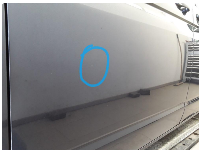
1.1 Steinsprut med rustboble