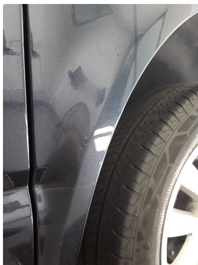
1.2 Steinsprut med rustboble