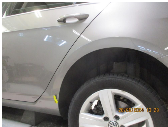
1.3 Lett korrosjon på bakskjermer + bakre del kanaler