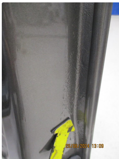
1.2 Korrosjon Innv. fals h.fordør.