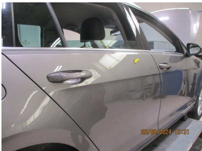
1.1 Parkeringsbult høyre bakdør