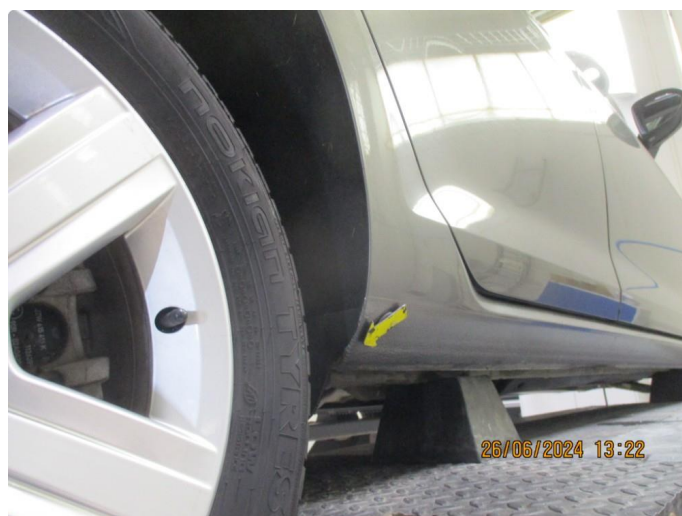
1.3 Lett korrosjon på bakskjermer + bakre del kanaler