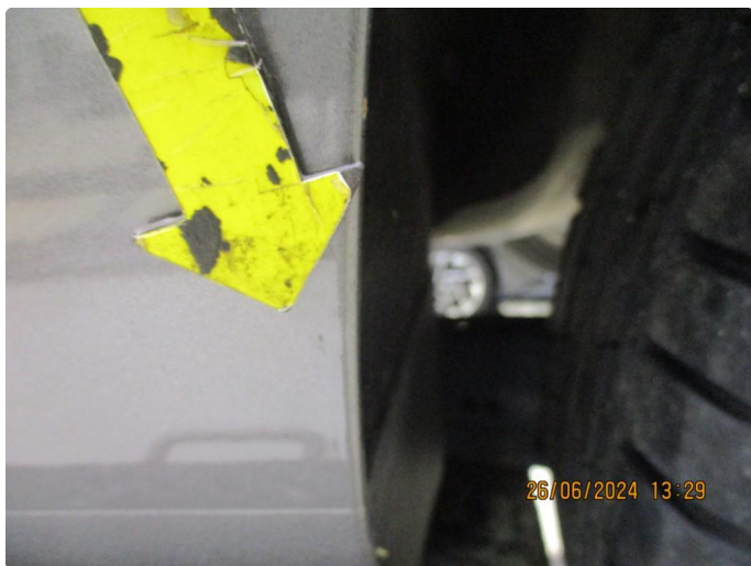
1.3 Lett korrosjon på bakskjermer + bakre del kanaler