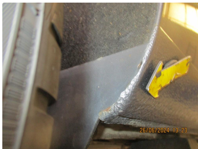
1.3 Lett korrosjon på bakskjermer + bakre del kanaler