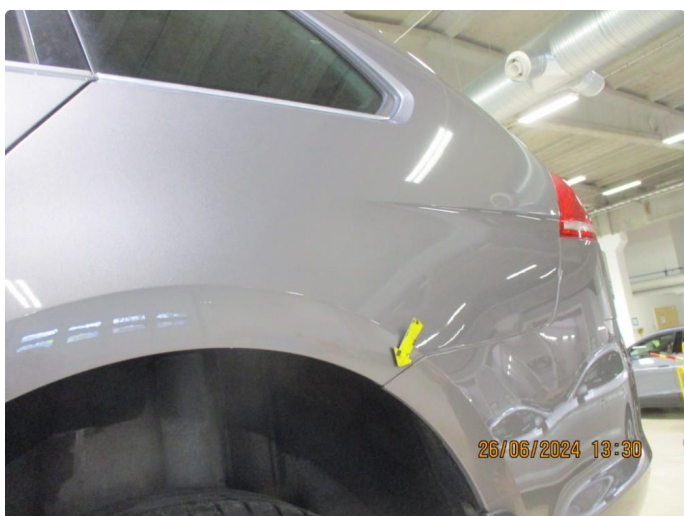
1.3 Lett korrosjon på bakskjermer + bakre del kanaler