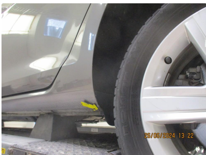
1.3 Lett korrosjon på bakskjermer + bakre del kanaler