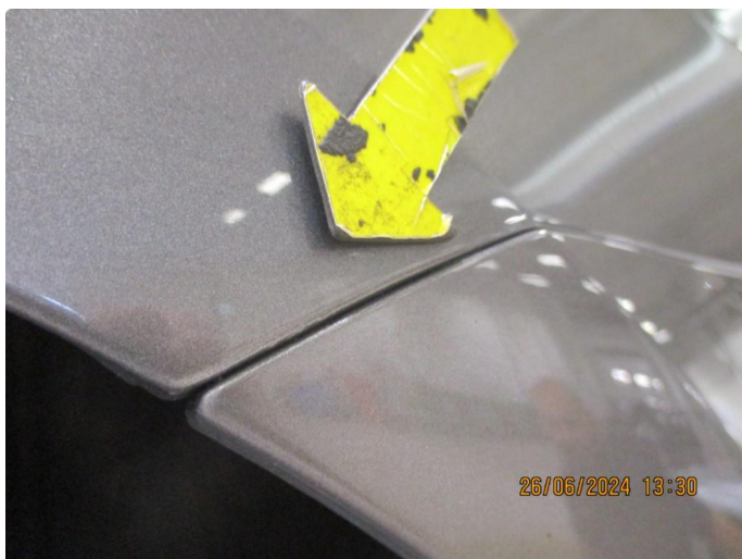
1.3 Lett korrosjon på bakskjermer + bakre del kanaler