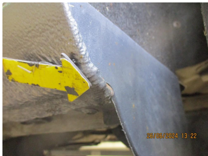
1.3 Lett korrosjon på bakskjermer + bakre del kanaler