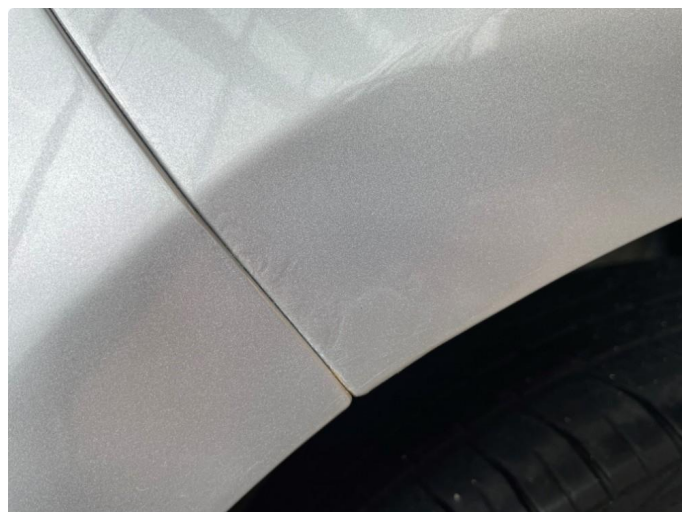
1.2 Rust under lakk/rustbobler