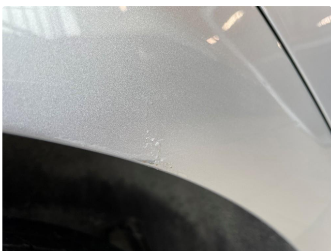
1.2 Rust under lakk/rustbobler