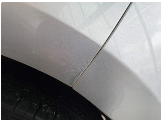
1.2 Rust under lakk/rustbobler