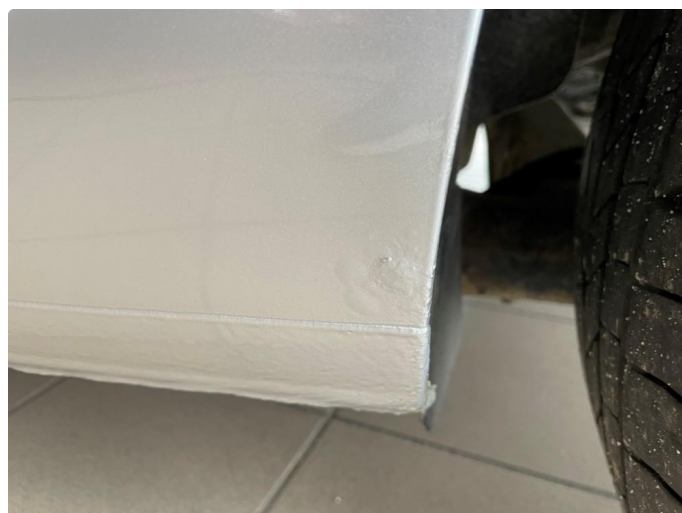
1.2 Rust under lakk/rustbobler