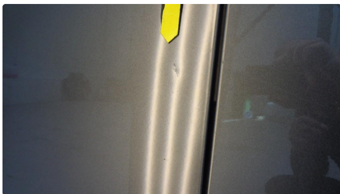
1.3 Liten bulk venstre dør