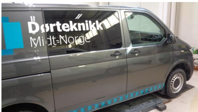
1.1 Høyre dør foran er omlakkert - uvisst av hvem, finner ingen historikk.