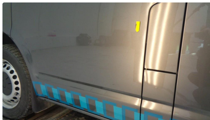
1.3 Liten bulk venstre dør