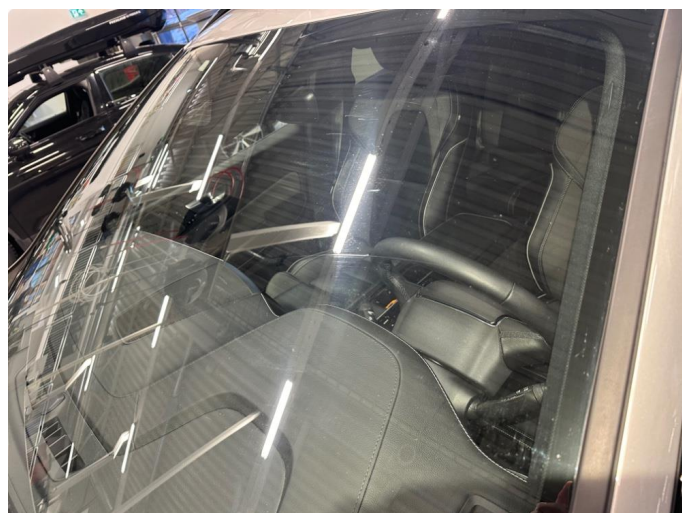
1.3 Riper i synsfelt