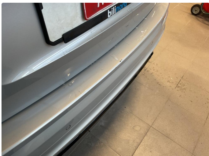
1.2 Skrapemerker innlastingszone