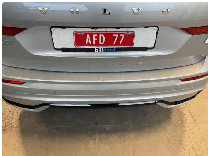
1.2 Skrapemerker innlastingszone