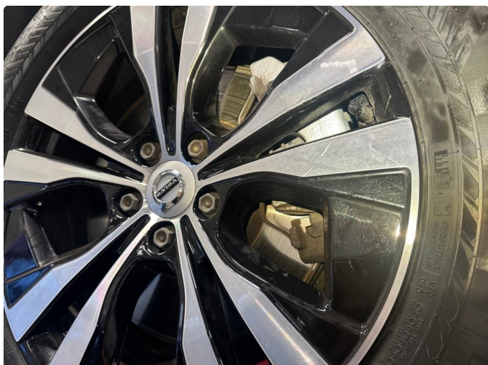
1.1 Liten ripe 1 vinterfelg