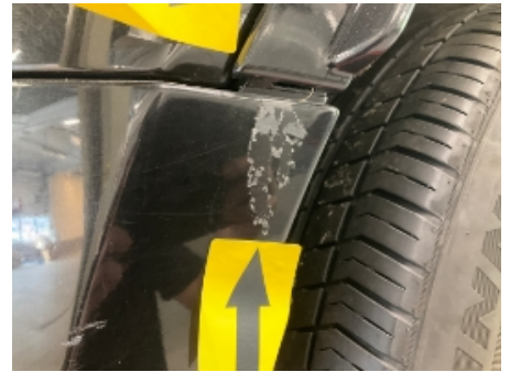
39. Støtfanger bak