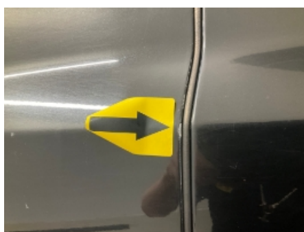
35. Venstre fordør