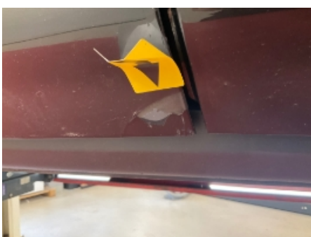
34. Venstre fordør