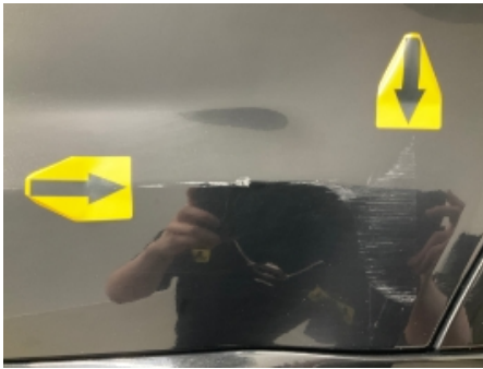
37. Venstre baktør