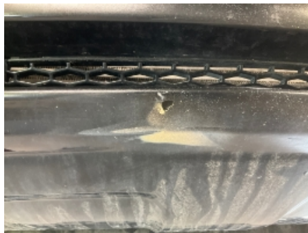
32. Støtfanger foran