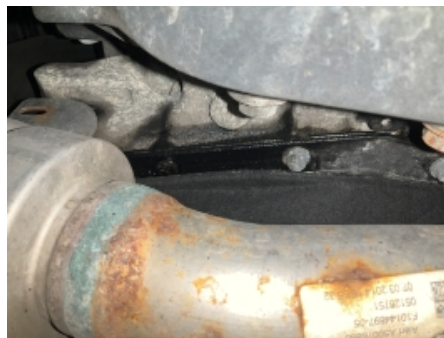
17. Utvendig tilstand motor