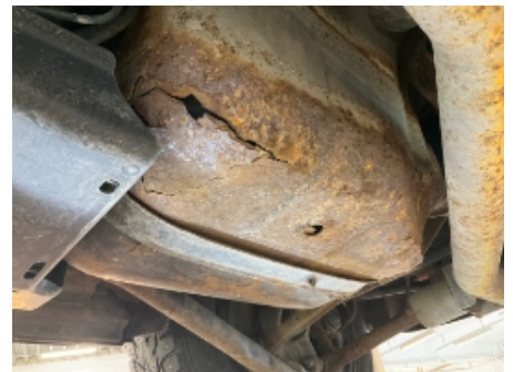
21. Drivstofftank, rør, slange