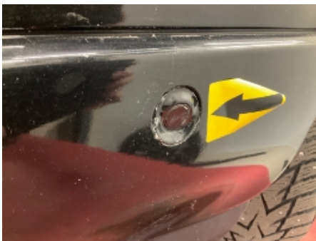
16. Lyd / lyssignaler