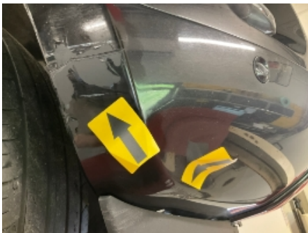
31. Støtfanger foran