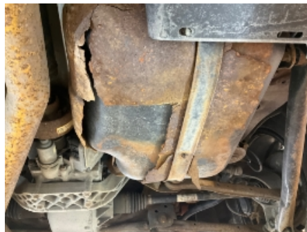
20. Drivstofftank, rør, slange