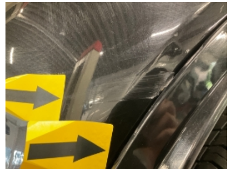
42. Høyre baksjerm