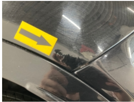
38. Venstre baksjerm