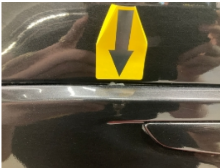
40. Høyre baktør