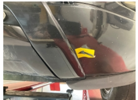
33. Støtfanger foran