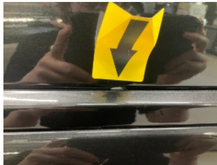
41. Høyre baktør