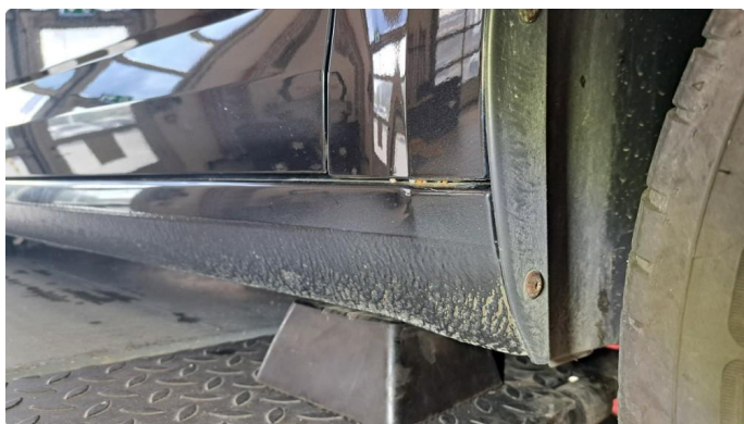
1.1 Litt lakslitasje bak hjul.