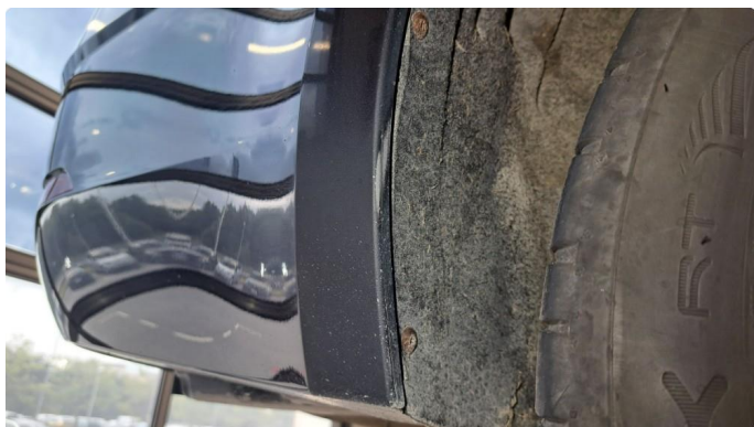
1.1 Litt lakslitasje bak hjul.