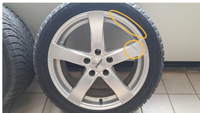
1.3 Kantkjørt felg 2 vinterhjul