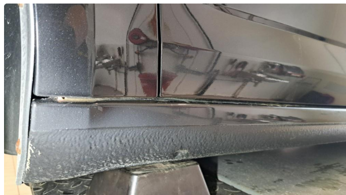
1.1 Litt lakslitasje bak hjul.