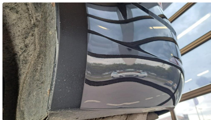
1.1 Litt lakslitasje bak hjul.