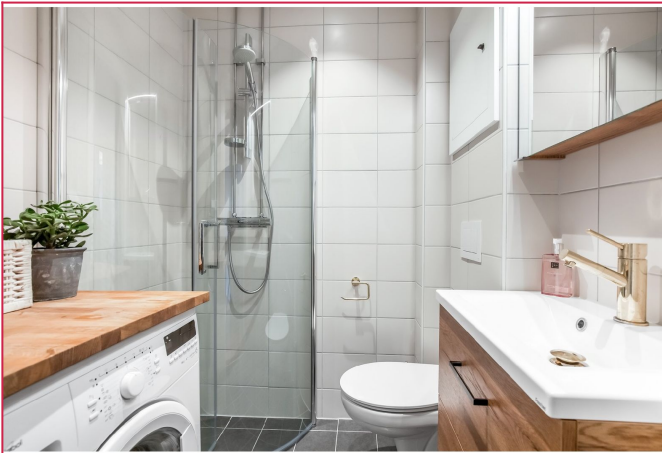
Flott bad med opplegg for vaskemaskin