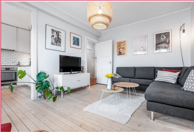
Fin stue med plass til sofagruppe