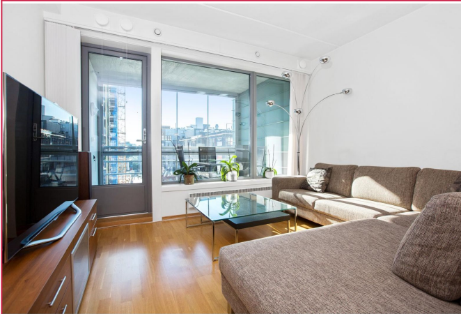
Stuen med utgang til innglasset sydvendt balkong