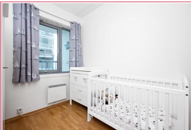
Minste soverom 2