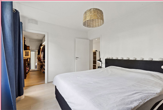
Fra hovedsoverrommet er det inngang til innvendig bod med garderobeløsning.