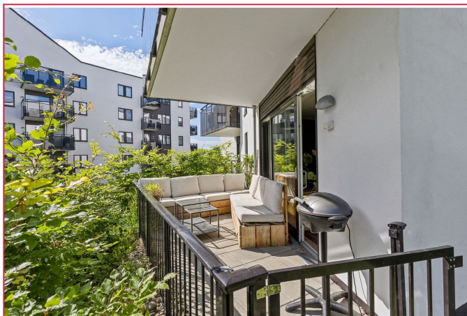
God plass til utemøbler.