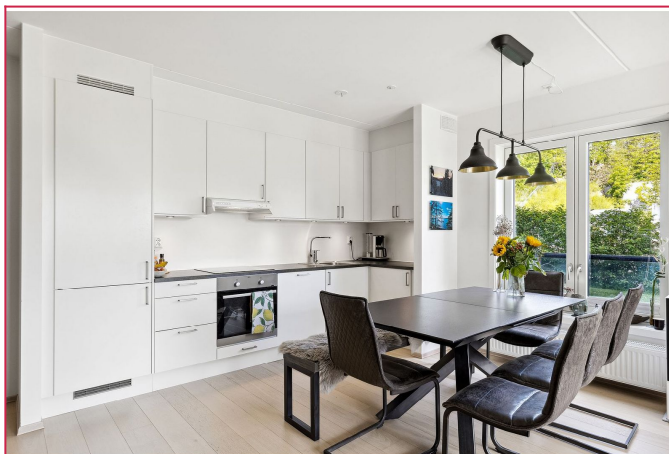
Pent kjøkken med integrerte hvitevarer.