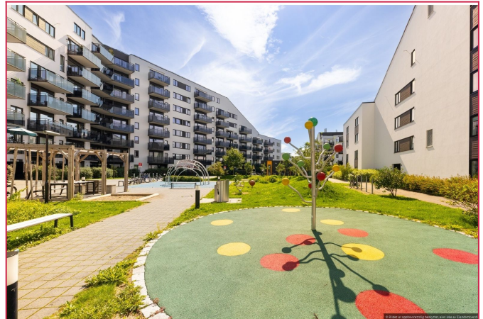
Leiligheten har en sentral og barnevennlig beliggenhet Økern.