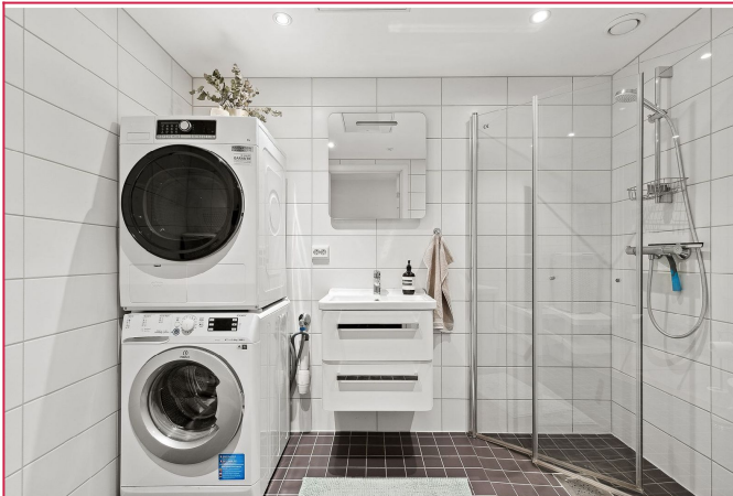
Stort, flislagt bad.