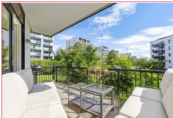
Fra stuen er det utgang til en stor og solrik terrasse.