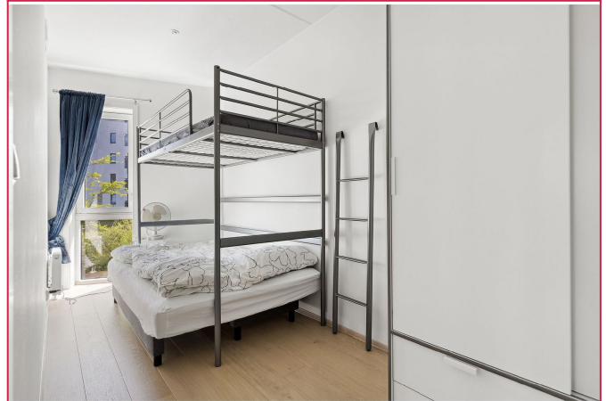
Soverom nr. 2 med garderobeskap.